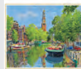
5-6月 鳩のいる運河/オランダ