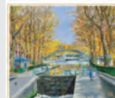
9-10月 秋のサンマルタン運河/フランス