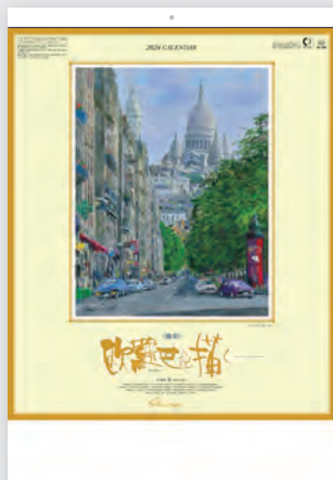
サクレクールへの道/フランス