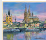
11-12月 ケルンの夜景/ドイツ