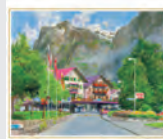
7-8月 グリンデルワルトの道/ スイス