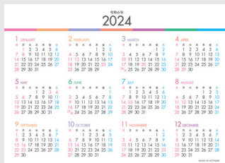
※12月裏面には年表を掲載